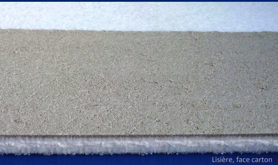
Lisière, face carton

Tapis moderne, avec fibres d'aiguilletage denses et très résistantes, pour les machines rapides de nouvelle génération. Grâce à sa perméabilité élevée, il favorise l'aplat et la qualité du carton. Sa structure renforcée lui confère une très bonne durée de vie .