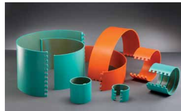
▲ Полиуретановая продукция Rodicut