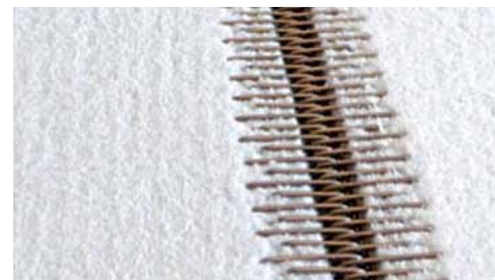
▲ Сушильные сукна Bricq