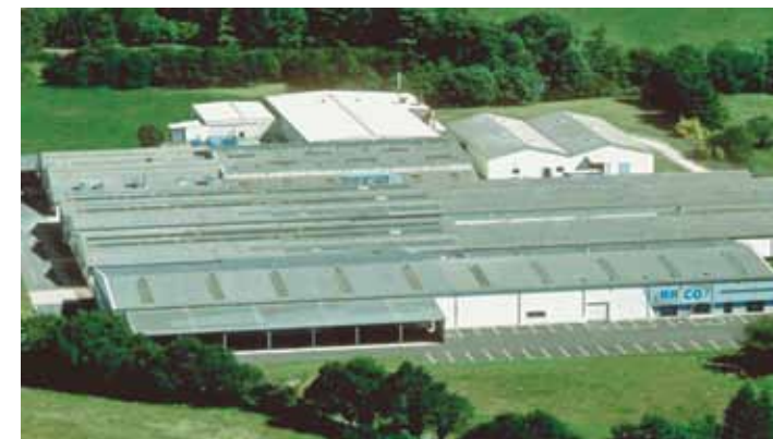
▲ Завод по производству сушильных сукон Bricq

Моя идея заключается в том, чтобы в дальнейшем приобретать дополнительные филиалы каждый раз, когда есть возможность, всегда оценивая прежде всего «ноу-хау», человеческие ресурсы, качества компании и перспективы ее развития.