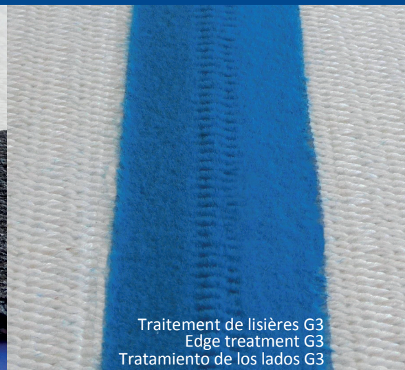
Traitement de lisières G3 Edge treatment G3 Tratamiento de los lados G3